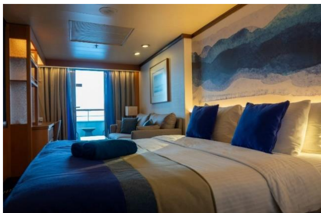
Suite Junior Externa SJB