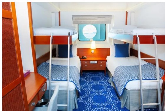
Cabine Interna IB

Cabine 17m 2 com duas camas baixas de solteiro (que podem ser convertidas em cama de casal mediante solicitação com antecedência), banheiro, telefone, secador de cabelo, cofre e TV.