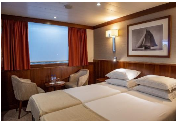
CABINE DECK PRINCIPAL

Cabines de aproximadamente 15m 2 com janelas panorâmicas (não abrem), ar-condicionado, telefone interno, cofre e TV.