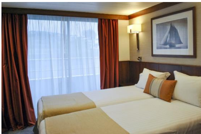
CABINE DECK SUPERIOR

Cabines de aproximadamente 15m 2 com sacada francesa, ar-condicionado, telefone interno, cofre e TV.